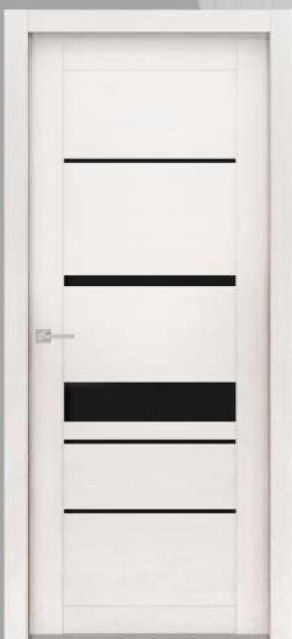
Айс светлый, стекло Черный Лакобель