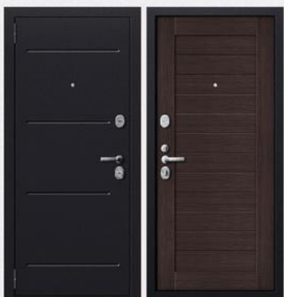
SD Prof-52 Венге

Покрытие внутри: профильная панель МДФ - 12мм, цвет - светлый дуб Покрытие снаружи: темное серебро с тиснением Толщина полотна: 72 мм Толщина металла: 1,5 мм Коробка: утепленный профиль толщиной 1,5 мм Дополнительно: Ребра жесткости, 2 контура звуко-пылеизоляции Утеплитель дверного полотна: негорючая минеральная плита Knauf Замки: 2 замка CRIT: врезной замок ЗВ-А8 серии "Ассистент" и замок врезной сувальдный ЗВ-А10-4Л серии «Ассистент» Другая фурнитура: врезная броненакладка, дверной глазок с углом обзора в 180°, шторка автомат (ключевина), накладка под цилиндр, врезная задвижка и цилиндрический механизм 90мм и 2 противосъемных штыря. Фурнитура «хром»