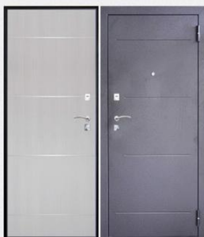
SD Prof-2 Молдинг Светлый дуб

Покрытие внутри: панель МДФ толщиной 6 мм с молдингами, цвет - венге Покрытие снаружи: темное серебро с тиснением Толщина дверного полотна: 65 мм Толщина стали на полотне: 1.2 мм Обозначение конструктива: ДГП(DGP) Замки: нижний - МЕТТЭМ ЗВ4 402.0.0, верхний - МЕТТЭМ® ЗВ8 852.0.0 Дверной глазок: 180° Количество петель: 2 петли на торцевых подшипниках Толщина металла дверного коробка: сложный гнутый замкнутый профиль толщиной 1.2 мм. Звуко-пылеизоляции: 2 контура Количество усилителей жесткости полотна: 3 шт. Тип утепления полотна: Knauf Insulation Количество противосъемных штырей: 2 шт. Ручка: раздельная хром 412