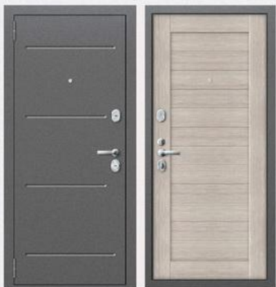
SD Prof-52 Светлый дуб

Покрытие внутри: профильная панель МДФ - 12мм, цвет - венге Покрытие снаружи: чёрный шелк с тиснением Толщина полотна: 72 мм Толщина металла: 1,5 мм Коробка: утепленный профиль толщиной 1,5 мм Дополнительно: Ребра жесткости, 2 контура звуко-пылеизоляции Утеплитель дверного полотна: негорючая минеральная плита Knauf Замки: 2 замка CRIT: врезной замок ЗВ-А8 серии "Ассистент" и замок врезной сувальдный ЗВ-А10-4Л серии «Ассистент» Другая фурнитура: врезная броненакладка, дверной глазок с углом обзора в 180°, шторка автомат (ключевина), накладка под цилиндр, врезная задвижка и цилиндрический механизм 90мм и 2 противосъемных штыря. Фурнитура «хром»