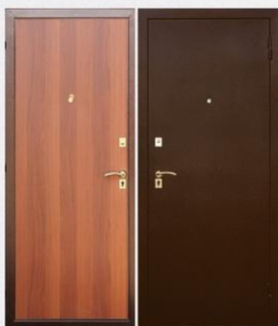
SD Prof-2 Стандарт Итальянский орех

Покрытие внутри: панель МДФ толщиной 6 мм с молдингами, цвет - светлый дуб Покрытие снаружи: темное серебро с тиснением Толщина дверного полотна: 65 мм Толщина стали на полотне: 1.2 мм Обозначение конструктива: ДГП(DGP) Замки: нижний - МЕТТЭМ ЗВ4 402.0.0, верхний - МЕТТЭМ® ЗВ8 852.0.0 Дверной глазок: 180° Количество петель: 2 петли на торцевых подшипниках Толщина металла дверного коробка: сложный гнутый замкнутый профиль толщиной 1.2 мм. Звуко-пылеизоляции: 2 контура Количество усилителей жесткости полотна: 3 шт. Тип утепления полотна: Knauf Insulation Количество противосъемных штырей: 2 шт. Ручка: раздельная хром 412