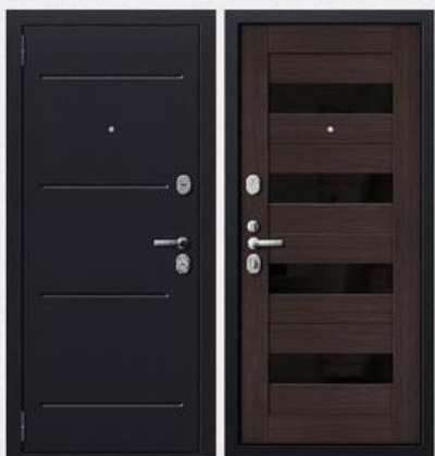
SD Prof-51 Венге

Покрытие внутри: профильная панель МДФ - 12мм, цвет - светлый дуб Покрытие снаружи: темное серебро с тиснением Толщина полотна: 72 мм Толщина металла: 1,5 мм Коробка: утепленный профиль толщиной 1,5 мм Дополнительно: Ребра жесткости, 2 контура звуко-пылеизоляции Утеплитель дверного полотна: негорючая минеральная плита Knauf Замки: 2 замка CRIT: врезной замок ЗВ-А8 серии "Ассистент" и замок врезной сувальдный ЗВ-А10-4Л серии «Ассистент» Другая фурнитура: врезная броненакладка, дверной глазок с углом обзора в 180°, шторка автомат (ключевина), накладка под цилиндр, врезная задвижка и цилиндрический механизм 90мм и 2 противосъемных штыря. Фурнитура «хром»