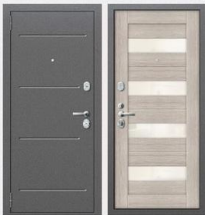
SD Prof-51 Светлый дуб

Покрытие внутри: профильная панель МДФ - 12мм, цвет - светлый дуб Покрытие снаружи: темное серебро с тиснением Толщина полотна: 72 мм Толщина металла: 1,5 мм Коробка: утепленный профиль толщиной 1,5 мм Дополнительно: Ребра жесткости, 2 контура звуко-пылеизоляции Утеплитель дверного полотна: негорючая минеральная плита Knauf Замки: 2 замка CRIT: врезной замок ЗВ-А8 серии "Ассистент" и замок врезной сувальдный ЗВ-А10-4Л серии «Ассистент» Другая фурнитура: врезная броненакладка, дверной глазок с углом обзора в 180°, шторка автомат (ключевина), накладка под цилиндр, врезная задвижка и цилиндрический механизм 90мм и 2 противосъемных штыря. Фурнитура «хром»