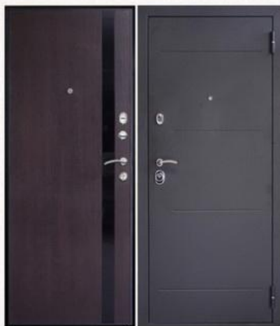
SD Prof-5 New Line Венге

Покрытие внутри: МДФ-панель облицованная экошпоном, 8 мм, цвета - светлый дуб Покрытие снаружи: темное серебро с тиснением Размеры дверного блока: 880x2050мм, 980x2050мм Количество петель: 2 петли на торцевых подшипниках Дверная коробка: сложный гнутый замкнутый утепленный профиль толщиной 1,5 мм. Толщина двери: 72 мм Дверное полотно: изготовлено из листа толщиной 1,5 мм Усиление полотна: множество горизонтальных и вертикальных усилителей заполненных пористым утепляющим составом и ребра жесткости Тип утепления полотна: негорючая минеральная плита Knauf Звуко-пылеизоляция: 2 контура, типа «D» Регулировка усилия закрывания: +/- 2мм Количество противосъемных штырей: 2 шт. Замки: Crit 3В-7PM-004 и 3В-А10-4Л Ассистент Дверной глазок: Аpecs 5016/50-90 Броненакладка: Аpecs Protector Pro 50/27 Задвижка дверная: Аpecs L-0260-CR и поворотник Аpecs Шторка: автоматическая (ключевина КП-С13) – 2шт Накладка: цилиндровая Аpecs Premier DP-C-05 – 1шт Цилиндровый механизм: 90мм (симметричный, без вертушки) Пластиковые заглушки для закрытия технологических отверстий Ручка: раздельная хром 412