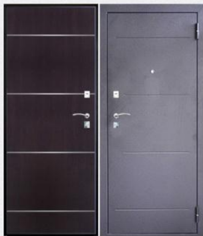
SD Prof-2 Молдинг Венге

Покрытие внутри: панель МДФ толщиной 6 мм с молдингами, цвет - венге Покрытие снаружи: темное серебро с тиснением Толщина дверного полотна: 65 мм Толщина стали на полотне: 1.2 мм Обозначение конструктива: ДГП(DGP) Замки: нижний - МЕТТЭМ ЗВ4 402.0.0, верхний - МЕТТЭМ® ЗВ8 852.0.0 Дверной глазок: 180° Количество петель: 2 петли на торцевых подшипниках Толщина металла дверного коробка: сложный гнутый замкнутый профиль толщиной 1.2 мм. Звуко-пылеизоляции: 2 контура Количество усилителей жесткости полотна: 3 шт. Тип утепления полотна: Knauf Insulation Количество противосъемных штырей: 2 шт. Ручка: раздельная хром 412