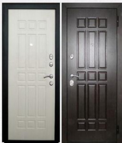
SD Prof-5 Сенатор Белёный дуб

Покрытие внутри: МДФ-панель облицованная ПВХ пленкой, 8 мм, цвет - белёный дуб Покрытие снаружи: внешняя фрезерованная панель толщиной 10мм + наличники, цвет - венге Размеры дверного блока: 880x2050мм, 980x2050мм Количество петель: 2 петли на торцевых подшипниках Дверная коробка: сложный гнутый замкнутый утепленный профиль толщиной 1,5 мм. Толщина двери: 72 мм Дверное полотно: изготовлено из листа толщиной 1,5 мм Усиление полотна: множество горизонтальных и вертикальных усилителей заполненных пористым утепляющим составом и ребра жесткости Тип утепления полотна: негорючая минеральная плита Knauf Звуко-пылеизоляция: 2 контура, типа «D» Регулировка усилия закрывания: +/- 2мм Количество противосъемных штырей: 2 шт. Замки: Crit 3В-7PM-004 и 3В-А10-4Л Ассистент Дверной глазок: Аpecs 5016/50-90 Броненакладка: Аpecs Protector Pro 50/27 Задвижка дверная: Аpecs L-0260-CR и поворотник Аpecs Шторка: автоматическая (ключевина КП-С13) – 2шт Накладка: цилиндровая Аpecs Premier DP-C-05 – 1шт Цилиндровый механизм: 90мм (симметричный, без вертушки) Пластиковые заглушки для закрытия технологических отверстий Ручка: раздельная хром 412