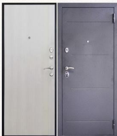
SD Prof-5 New Line Светлый дуб

Покрытие внутри: МДФ-панель облицованная ПВХ пленкой, 8 мм, цвет - белёный дуб Покрытие снаружи: внешняя фрезерованная панель толщиной 10мм + наличники, цвет - венге Размеры дверного блока: 880x2050мм, 980x2050мм Количество петель: 2 петли на торцевых подшипниках Дверная коробка: сложный гнутый замкнутый утепленный профиль толщиной 1,5 мм. Толщина двери: 72 мм Дверное полотно: изготовлено из листа толщиной 1,5 мм Усиление полотна: множество горизонтальных и вертикальных усилителей заполненных пористым утепляющим составом и ребра жесткости Тип утепления полотна: негорючая минеральная плита Knauf Звуко-пылеизоляция: 2 контура, типа «D» Регулировка усилия закрывания: +/- 2мм Количество противосъемных штырей: 2 шт. Замки: Crit 3В-7PM-004 и 3В-А10-4Л Ассистент Дверной глазок: Аpecs 5016/50-90 Броненакладка: Аpecs Protector Pro 50/27 Задвижка дверная: Аpecs L-0260-CR и поворотник Аpecs Шторка: автоматическая (ключевина КП-С13) – 2шт Накладка: цилиндровая Аpecs Premier DP-C-05 – 1шт Цилиндровый механизм: 90мм (симметричный, без вертушки) Пластиковые заглушки для закрытия технологических отверстий Ручка: раздельная хром 412